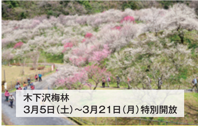
木下沢梅林 3月5日(土)~3月21日(月)特別開放

旧甲州街道と小仏川に沿う民家の庭先、山の斜面、畑などに、梅が香り高くほころびかけています。梅の花をめりながら、散策をお楽しみください。